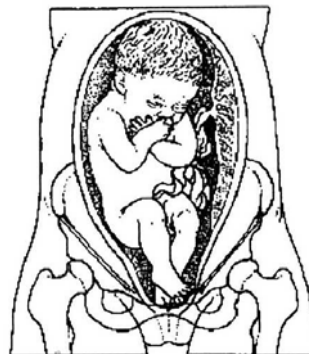
1d. Voetligging: benen gestrekt omlaag zodat één of beide voeten onder de billen lig(t)(gen).