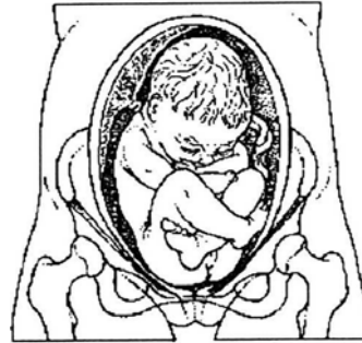
1b. Volkomen stuitligging: met gebogen knieën zodat de voeten naast de billen liggen.