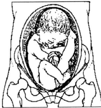
1c. Half (on)volkomen stuitligging: één been als volkomen, één been als onvolkomen stuitligging.